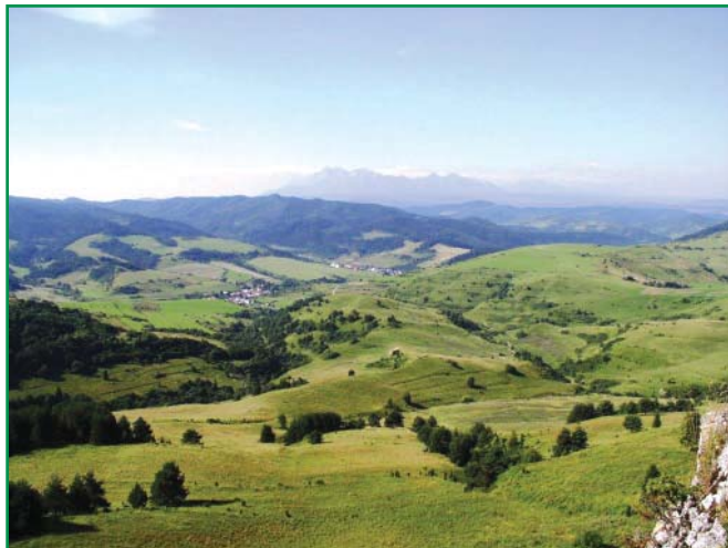
Pohľad z Malých Pienin na mozaiku lúčnych, krovitých a lesných spoločenstiev. V Kľč

To sa podarilo 17. júla 1932, kedy sa uskutočnilo slávnostné (Pokračovanie na 3. strane)